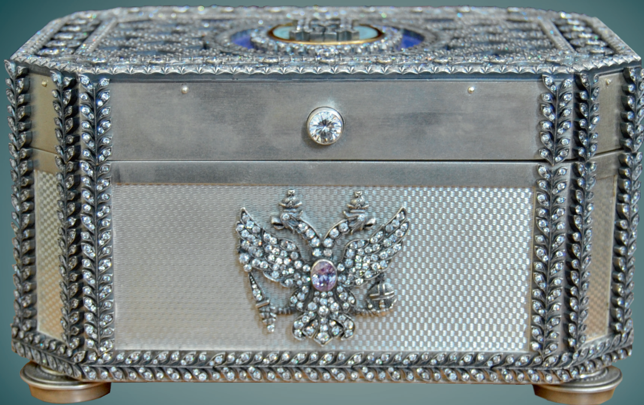
Ковчег с частицами мощей святого мученика и страстотерпца царя Николая