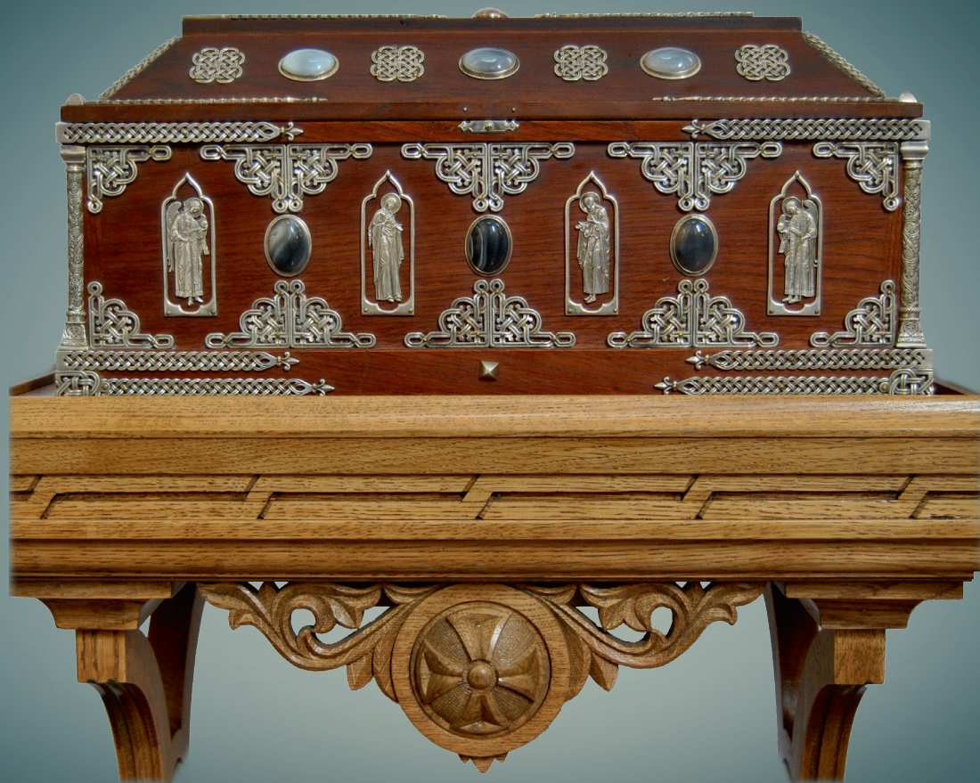
Ковчег с частицами мощей святителя Спиридона епископа Тримифунтского