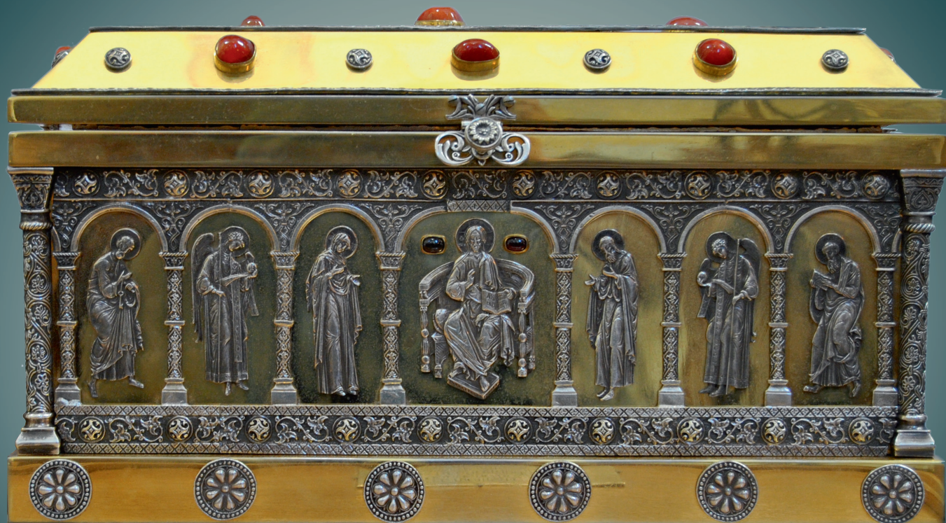
Ковчег с частицами мощей прп. Саввы Освященного и пеленой пропитанной миром от иконы Божией Матери Влахернская