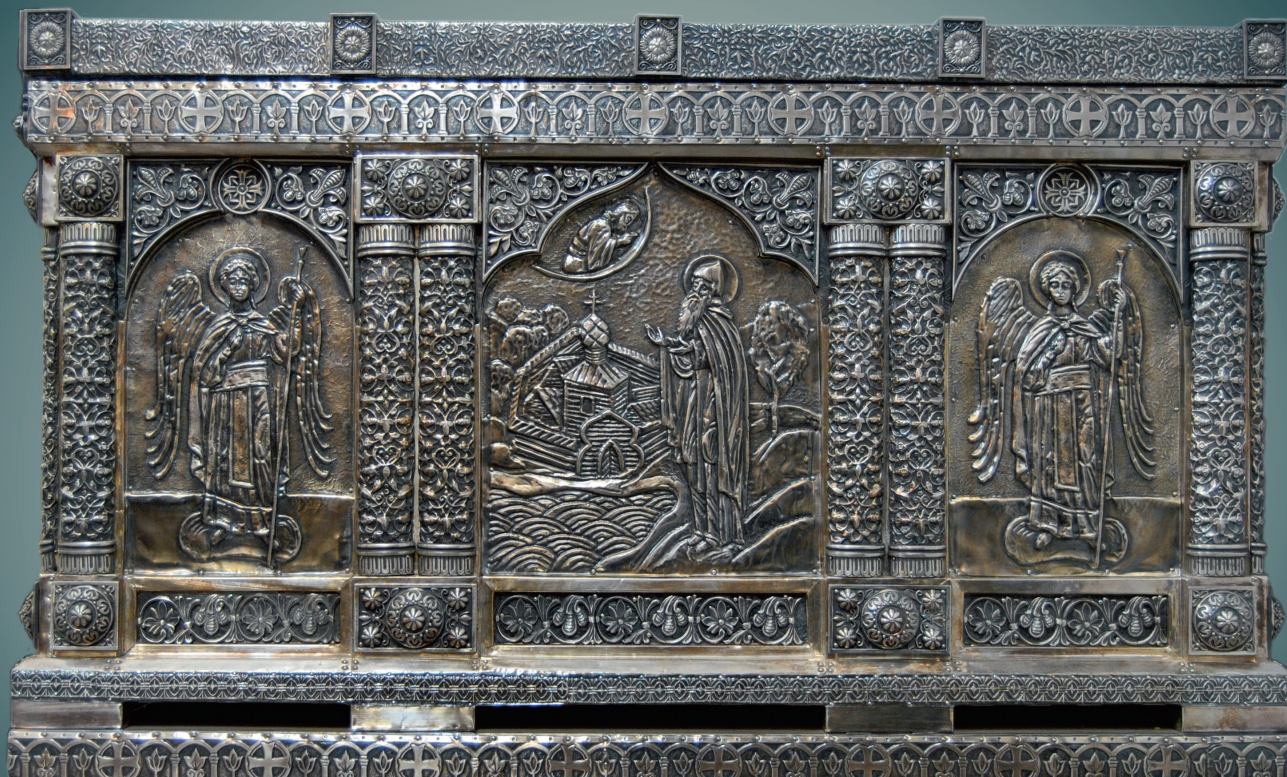
Ковчег с частицами мощей святого преподобного Антония Дымского