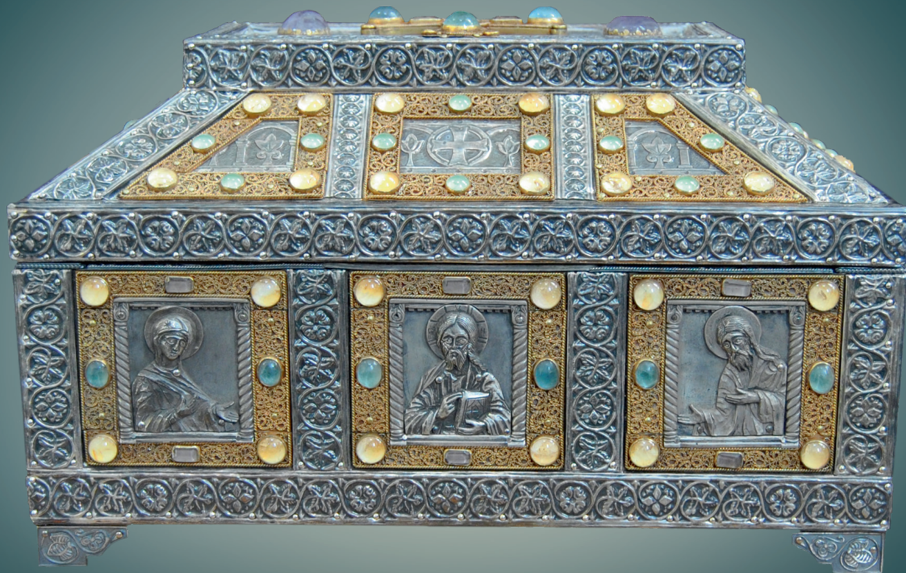
Ковчег с частицами мощей святого Виктора