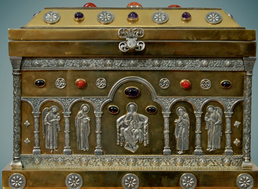
Ковчег с частицами мощей святого благоверного великого князя Александра Невского