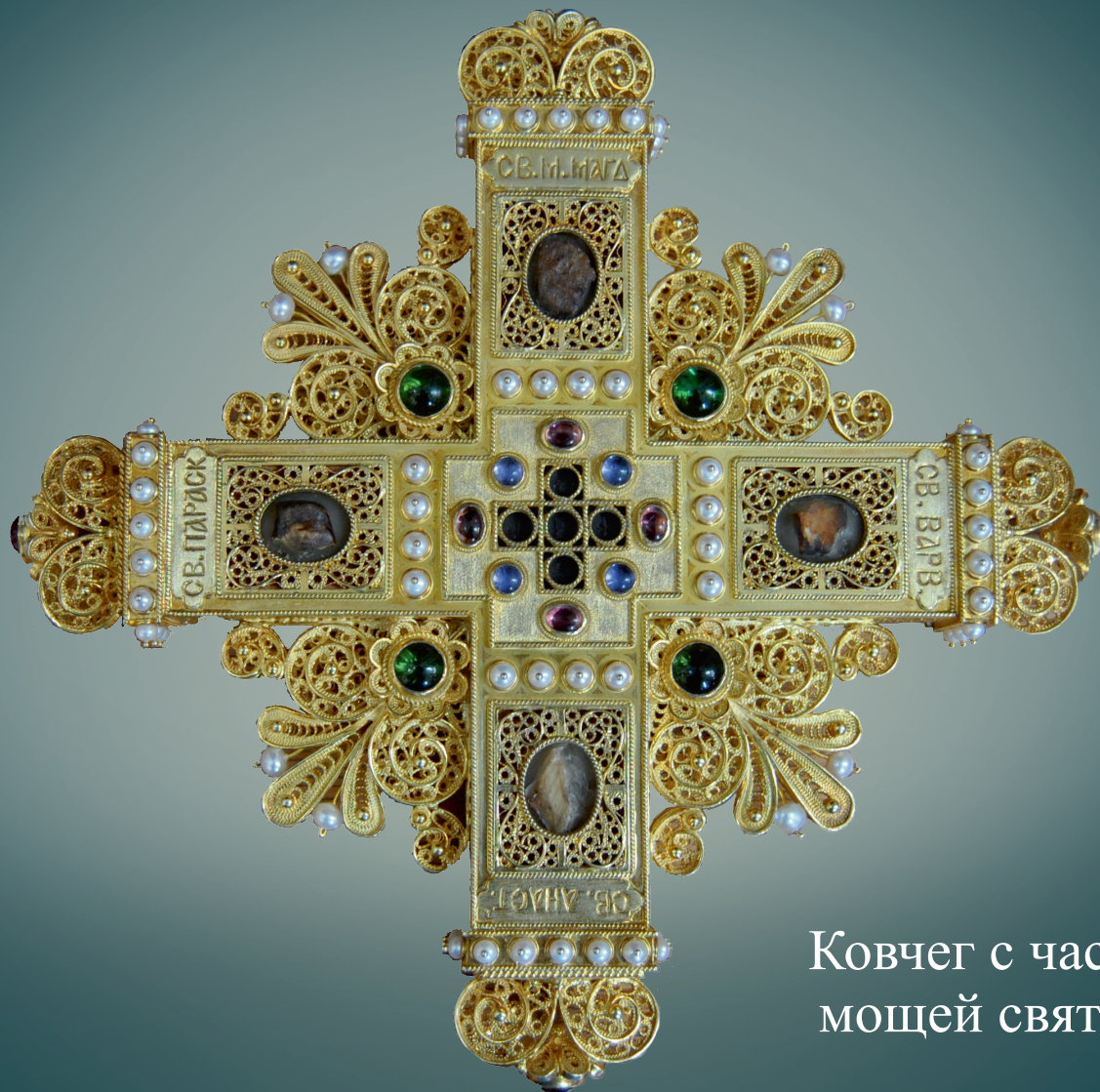
Ковчег с частицами мощей святых жен