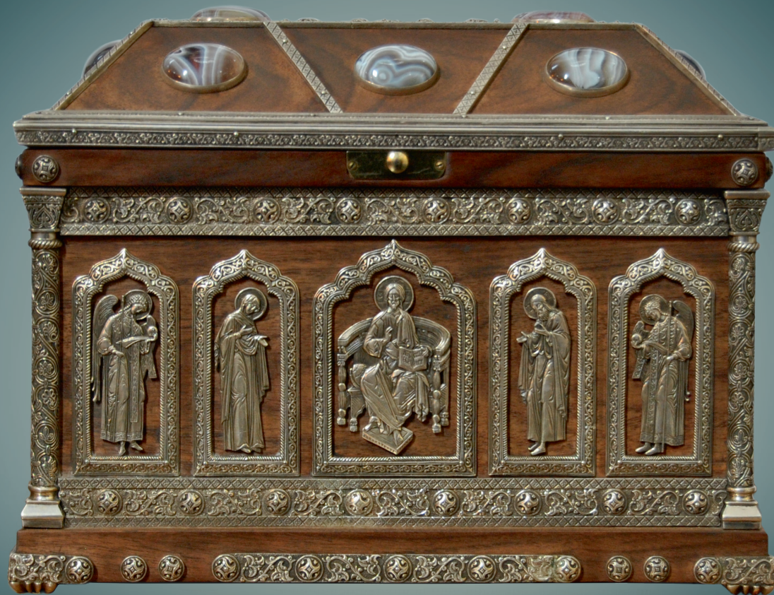
Ковчег с частицами мощей преподобномученика Николая Нового