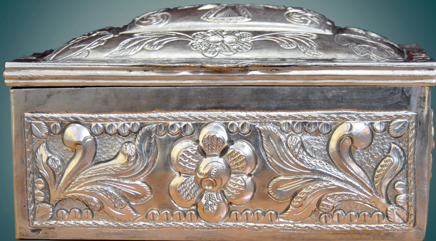
Ковчег с частицами мощей святого великомученика Мины