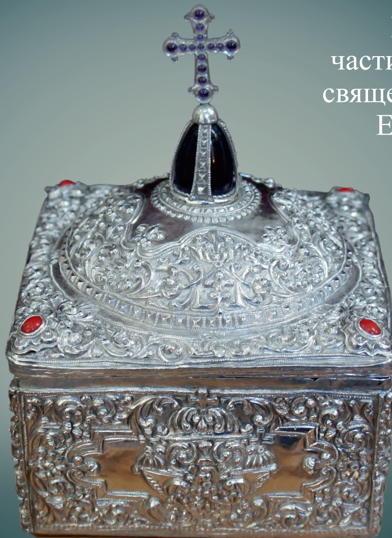
Ковчег с частицами мощей священномученика Елевферия