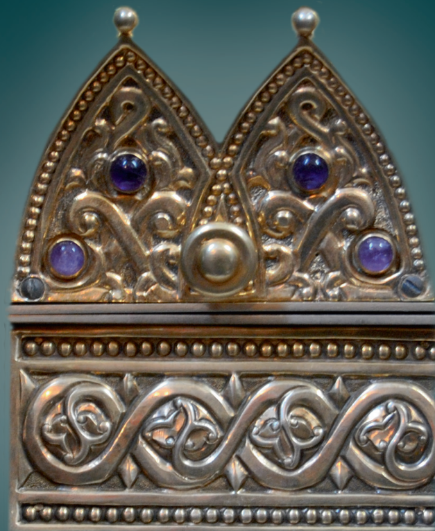
Ковчег с частицами мощей святых равноапостольных Константина и Елены