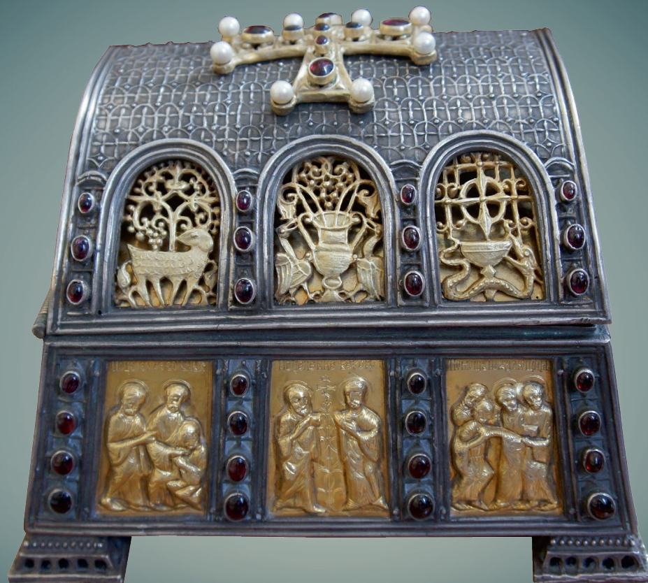
Ковчег с частицами мощей святых мучеников-бессребреников Космы и Дамиана