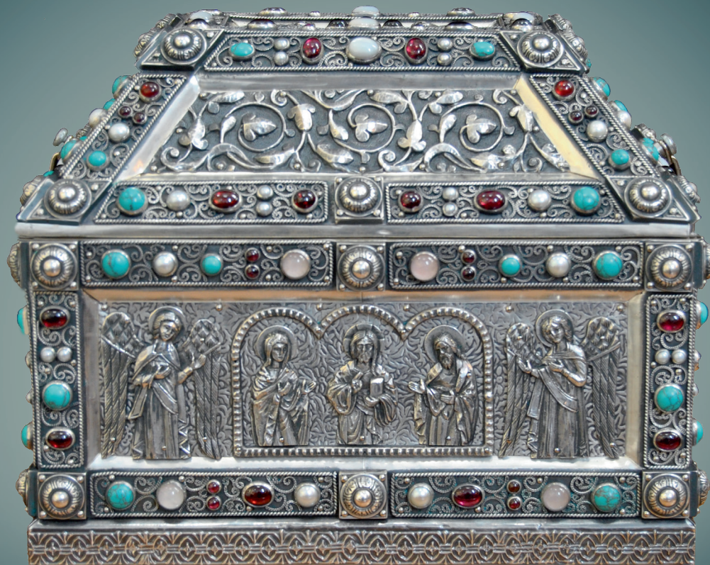
Ковчег с частицами мощей святых мучеников Кирика и Иулитты