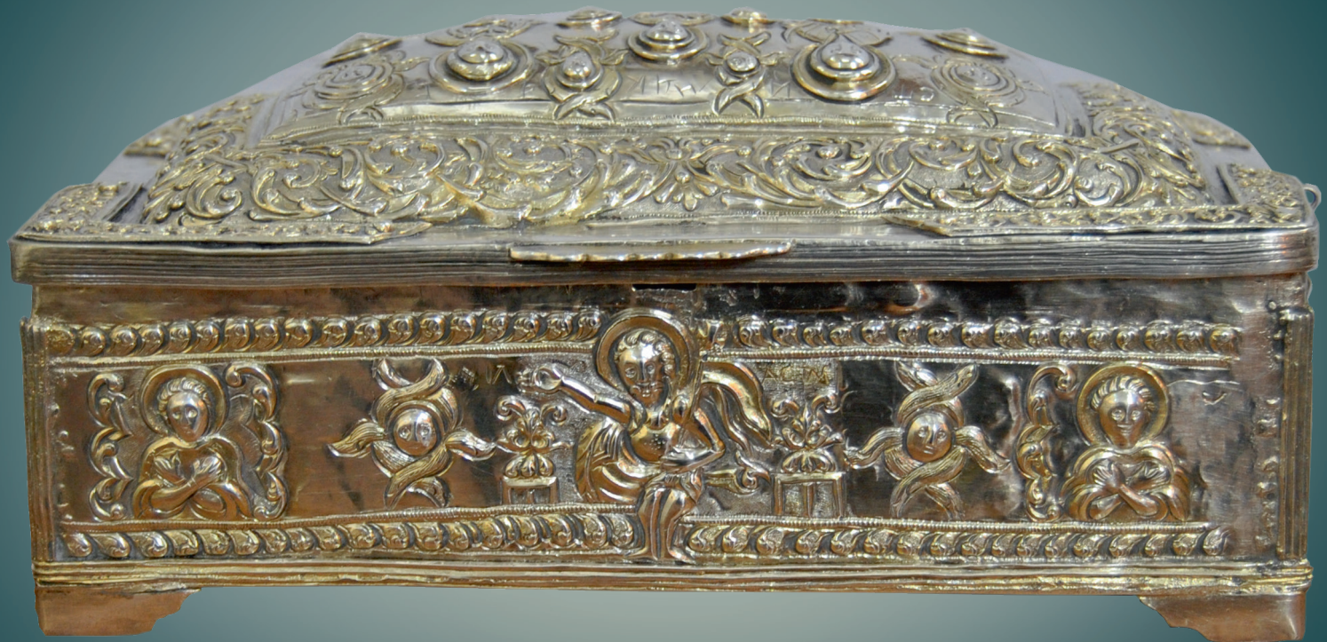
Ковчег с частицами мощей святого великомученика Феодора Стратилата